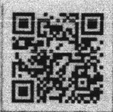
QR Code แบบสำรวจ

สำนักงานส่งเสริมการปกครองท้องถิ่นจังหวัด กลุ่มงานการเงินบัญชีและการตรวจสอบ โทร. ๐-๕๖๗๖-๕๗๘๑ ต่อ ๑๐๕