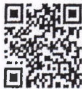
แบบสอบถาม