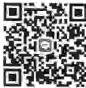
QR Code บันทึกข้อมูล User "CCTV จังหวัดเพชรบูรณ์"

กล้องโทรทัศน์วงจรปิด (CCTV) จังหวัดเพชรบูรณ์ ความไหลดเอกสารเรื่องเดิม/คู่มือการบันทึกข้อมูลฯ