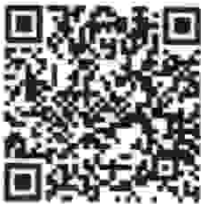
QR Code บันทึกยืนยันข้อมูล

กล้องโทรทัศน์วงจรปิด (CCTV) จังหวัดเพชรบูรณ์ ความไหลดเอกสารเรื่องเดิม/คู่มือการบันทึกข้อมูลฯ