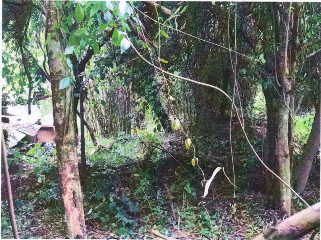
කොකුළු පිත්තල පත් කැපීමේ ස්ථානය