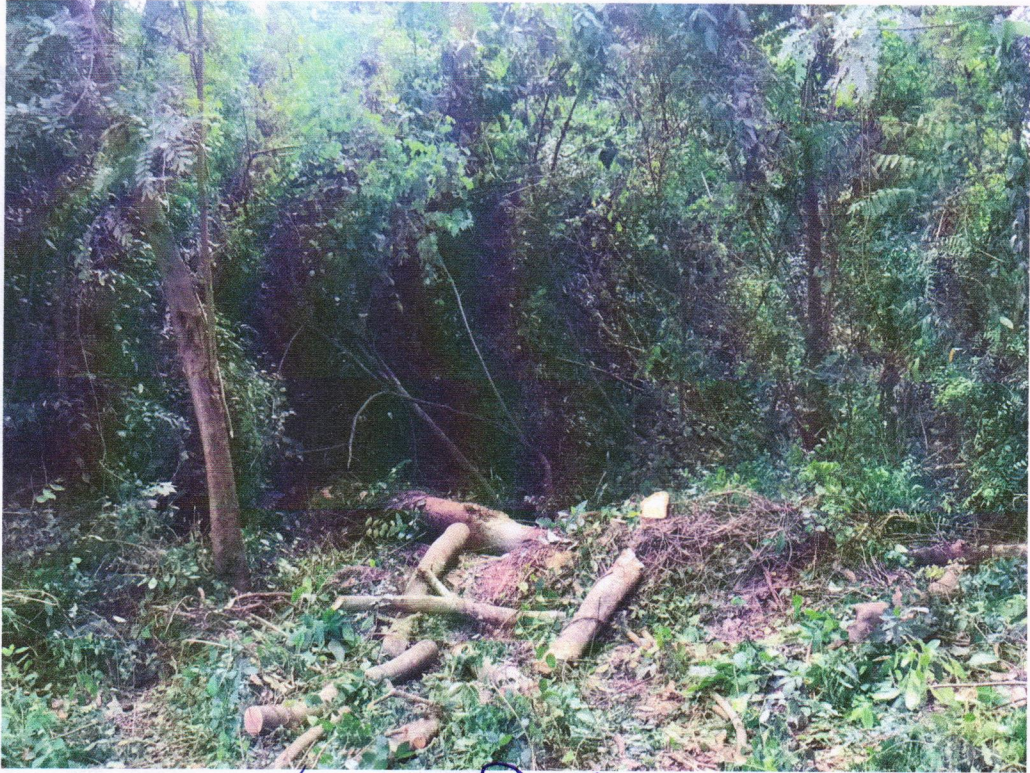
สภาพถนนในชุมชน รกทึบ