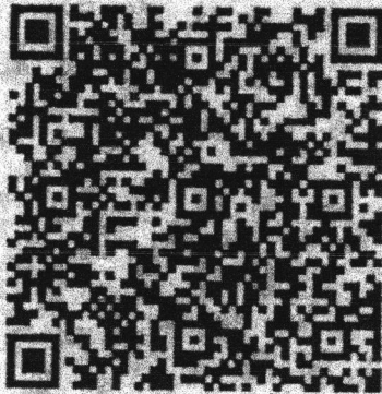
(สิ่งที่ส่งมาด้วย ๑)

ให้ Download ได้ที่ www.dla.go.th เมนูหนังสือราชการ หรือ QR CODE นี้