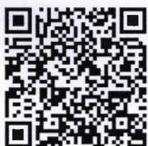
หนังสือโครงการ