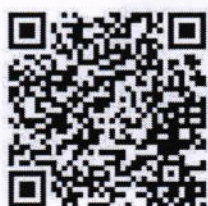
ส่งใบสมัคร