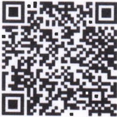
สิ่งที่ส่งมาด้วย ๑ แนวทางการขอรับการสนับสนุนฯ