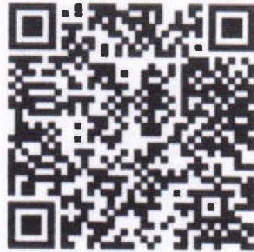
สิ่งที่ส่งมาด้วย ๒ หลักเกณฑ์ค่าใช้จ่ายที่สนับสนุน ประจำปี ๒๕๖๔