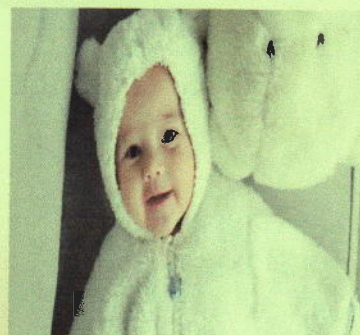
โครงการเงินอุดหนุน เพื่อการเลี้ยงดูเด็กแรกเกิด

องค์การบริหารส่วนตำบลดงมูลเหล็ก อำเภอเมืองเพชรบูรณ์ จังหวัดเพชรบูรณ์