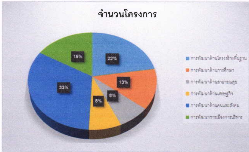
แผนภูมิวงกลม ประกอบตาราง ๑.งบประมาณรายจ่ายประจำปี พ.ศ. ๒๕๖๖