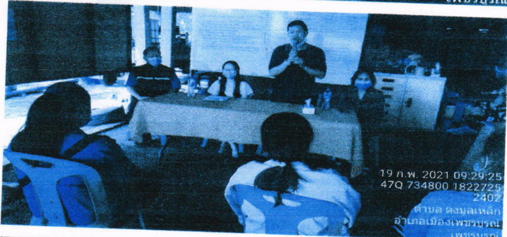
19 ก.พ. 2021 09:29:25 47Q 734800 1822725 2402 ตำบล ดงมูลเหล็ก อำเภอเมืองเพชรบูรณ์ เพชรบูรณ์