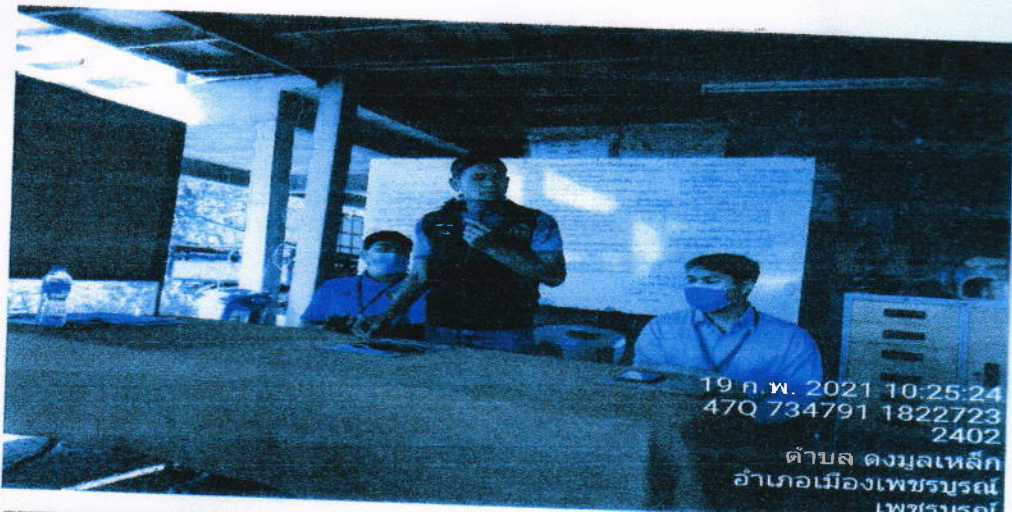
19 ก.พ. 2021 10:25:24 47Q 734791 1822723 2402 ตำบล ดงมูลเหล็ก อำเภอเมืองเพชรบูรณ์ เพชรบูรณ์