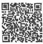
หลักเกณฑ์การเปิดโรงเรียนฯ

หัวหน้าผู้รับผิดชอบในการแก้ไขสถานการณ์ฉุกเฉิน ในส่วนที่เกี่ยวกับการสั่งการและประสานกับผู้ว่าราชการจังหวัด และผู้ว่าราชการกรุงเทพมหานคร